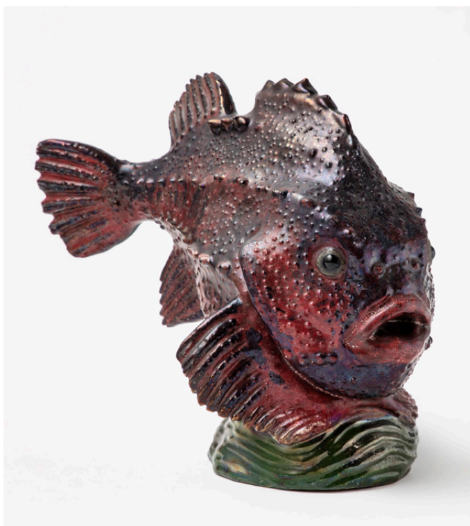
J. F. Willumsen Stenbider , 1896 Fajance med lustreglasur, støbt i form 28 × 25 × 12 cm Willumsens Museum