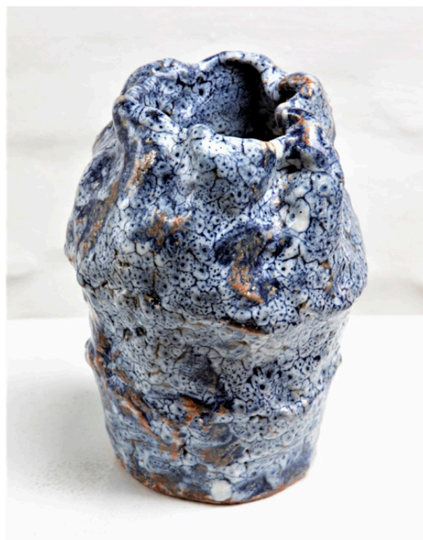
Jørgen Hansen Blå krukke fra udstillingen Resonans

Udstillingen kan ses frem til den 25. juni 2022. Galleriet har åbent fra tirsdag - fredag kl. 13-17 og lørdag fra kl. 10-14.