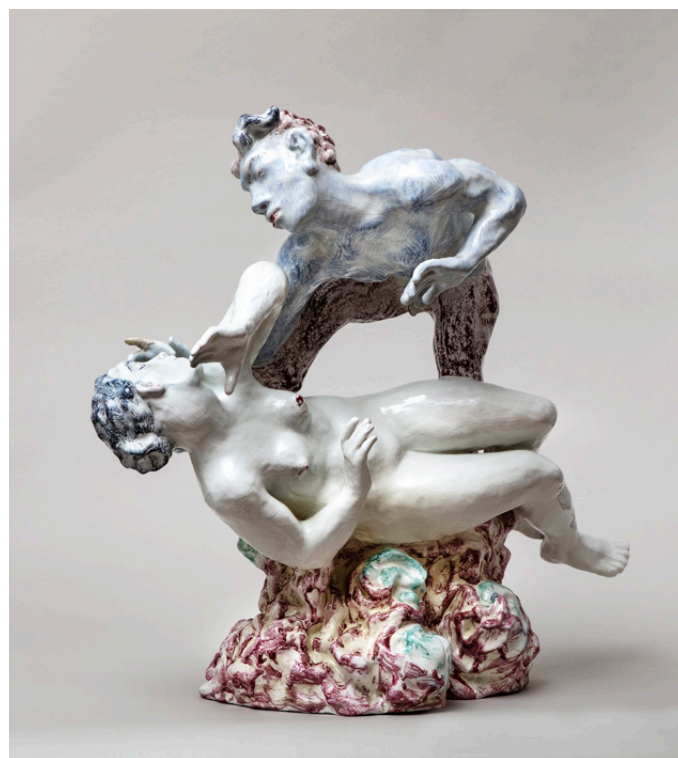
Jean René Gauguin Rosernes Seng , 1927 Fajance 56 × 60,5 × 26 cm CLAY - Royal Copenhagen Samlingen